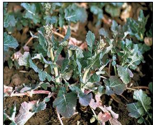
Deficiencia de boro al estado de elongación del tallo, se puede