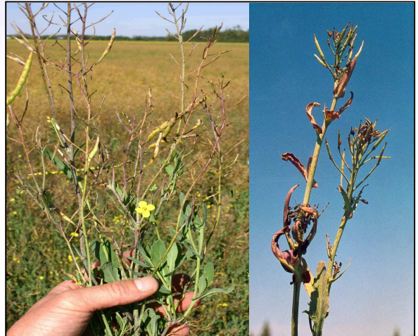
Deficiencia de boro manifestada en el tercio superior de la planta

En suelos sobre 1,5 ppm no resultaría aconsejable una aplicación de boro ya que se podrían manifestar síntomas de toxicidad. Es importante destacar que el margen entre deficiencia y toxicidad es estrecho, lo que hace necesario que la aplicación de boro como fertilizante se lleve a cabo de manera controlada.